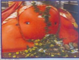
ಪಾಗಪ್ಪಲದಲ್ಲಿದ್ದು ತೆಗೆಟಿ ಗಣೇಶ