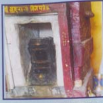
ಒದಿಯಲ್ಲಿದ್ದು ಶ್ರೀಲಾಭವೇಂದ್ರಸ್ವಾಮಿಗಳ್ ಪೂಜಾವಳಿ