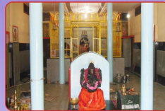
ನವೀಕರಣಗೊಂಡ ಹೊಸಗೂರಿನ ಶ್ರೀ ಶ್ರೀಪಾದರಾಜ ಮಠ