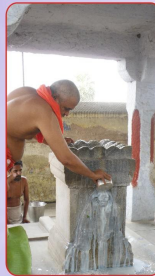
ಶ್ರೀ ಮೇಧಾನಿಧಿಶೀರ್ಷಕರ ಆರಾಧನೆಯನ್ನು ಶ್ರೀ ಕೇಶವನಿಧಿಶೀರ್ಷಕರು ಬೃಂದಾವನಕ್ಕೆ ಅಧಿಕಾರ ನಡೆಸುತ್ತಿರುವುದು