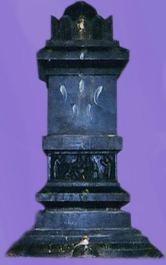
ಶ್ರೀ ಕೇಶವನಿಧಿಶೀರ್ಷಕ ಶ್ರೀ ವಿದ್ಯಾಪ್ರಸನ್ನತೀರ್ಥರ ಬೃಂದಾವನ